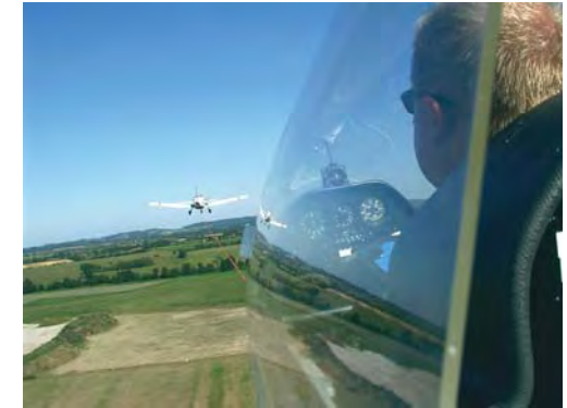
Unser Doppelsitzer „GT“ (Golf-Tango) hinter unserem Schleppflugzeug