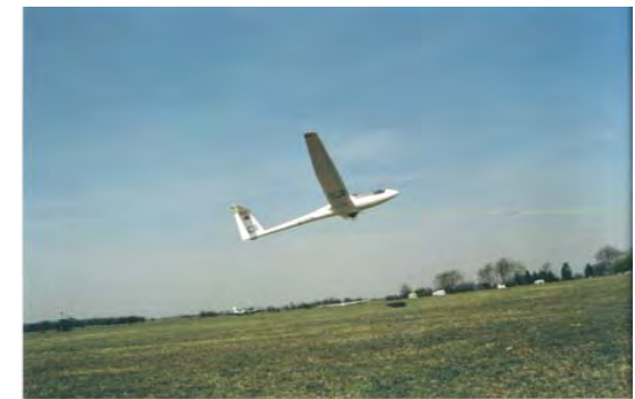
Unser Leistungseinsitzer „C8“ (Charly 8) im Windenstart

Bei der zweiten, mit der wir viel häufiger starten, wird das Segelflugzeug mit einem langen Stahlseil von unserer 260 PS starken Seilwinde, einem Drachen gleich, in den Himmel gezogen.